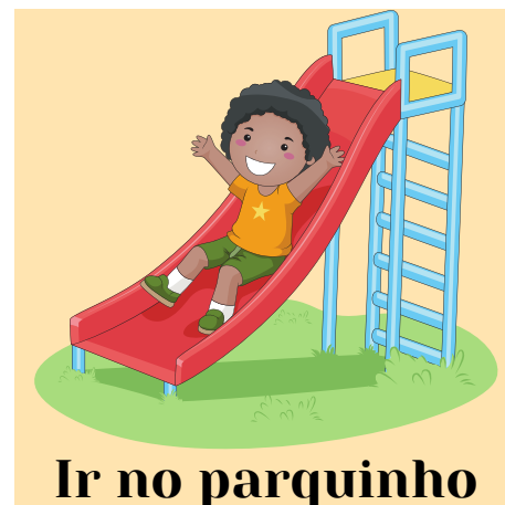
Ir no parquinho