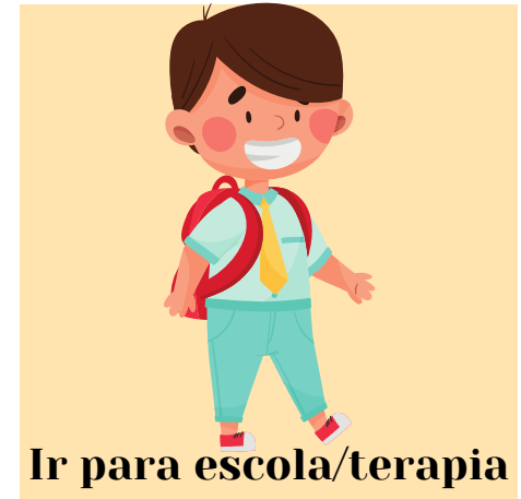
Ir para escola/terapia