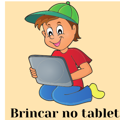
Brincar no tablet